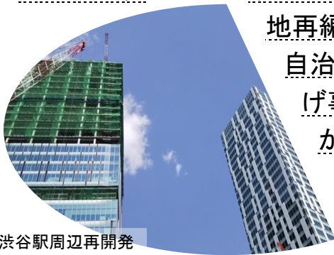
渋谷駅周辺再開発

ツーパーによる再開発準備組合の掘り起こしから都市計画変更へ—足立区北千住 駅東口／区画整理の最近の展開—公共公益施設用地再編と超高層ビルづくり—港区田町駅東口北／