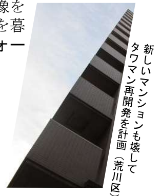
新しいマンションも壊して タワマン再開発を計画(荒川区)

… 秘密主義を打破し、権利者、市民とともに再開発とどう向き合うか。再開発が 多額の税金投入 と地権者の土地の収奪にほかならなかった…その内実をどう暴くか、議会、市民、住民からみた 再開発の実像 を追う。