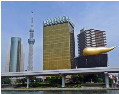
時が都市を切り裂く—東京スカイツリー (HPに評釈掲載)